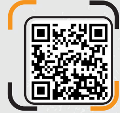
ESKİŞEHİR TREN GARI TOPLANMA NOKTASI