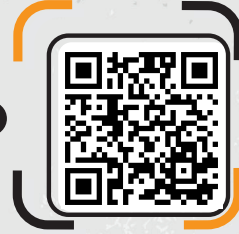
TÜRK KIZILAY HASIRCA GENÇLİK KAMPI KAMP ALANI