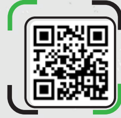
TÜRK KIZILAY HEYBELİADA GENÇLİK KAMPI KAMP ALANI