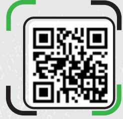
KADIKÖY/BOSTANCI VAPUR İSKELESİ TOPLANMA NOKTASI